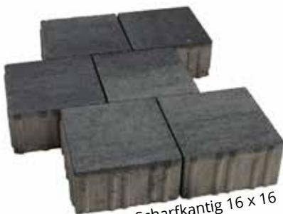
Centra Scharfkantig 16 x 16 Anthrazit Töne